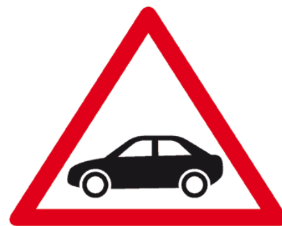
Conducción: ver prospecto

Cuando se emplean medicamentos resulta siempre recomendable leer atentamente el prospecto de los medicamentos. En el caso de los medicamentos antiparkinsonianos, conviene destacar que existen una serie de características comunes en su etiquetado con respecto a los riesgos que pueden producirse en la conducción , que han quedado recogidos en una tabla elaborada por la Agencia Española de Medicamentos y Productos Sanitarios (AEMPS). Normalmente todo medicamento que presente problemas para la conducción incluye el pictograma de conducción como el que se muestra (imagen obtenida desde la Agencia Española de Medicamentos y Productos Sanitarios).